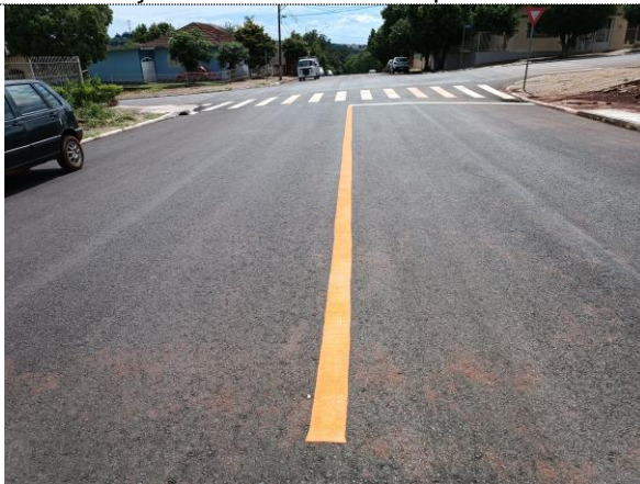
Sinalização horizontal Rua Duque de Caxias.