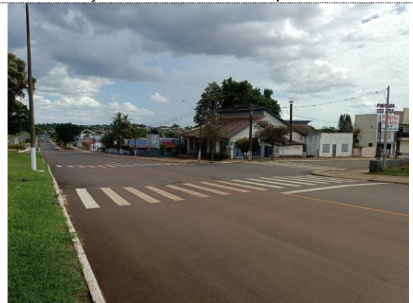
Sinalização horizontal Avenida Nilo Bazzo.