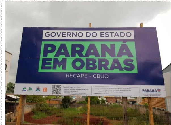
Placa de Obra