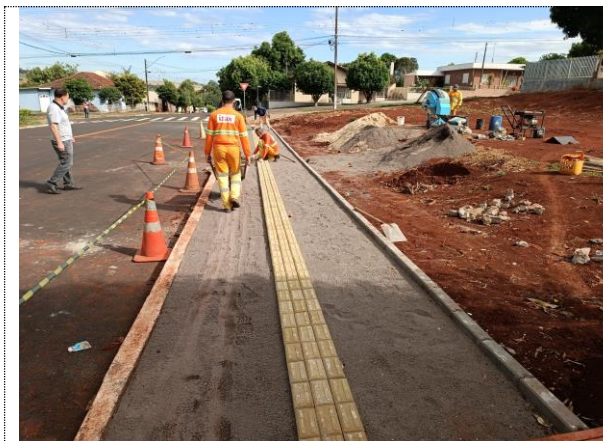
Execução de passeio público