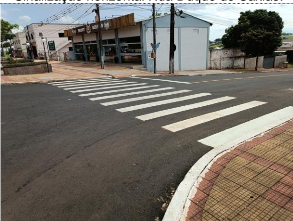
Sinalização horizontal Avenida Nilo Bazzo.