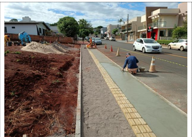
Execução de passeio público