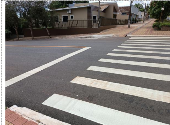
Sinalização horizontal Avenida Nilo Bazzo.