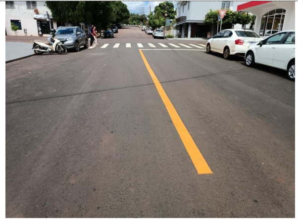
Sinalização horizontal Rua Duque de Caxias.