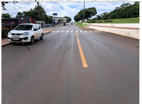
Sinalização horizontal Avenida Nilo Bazzo.