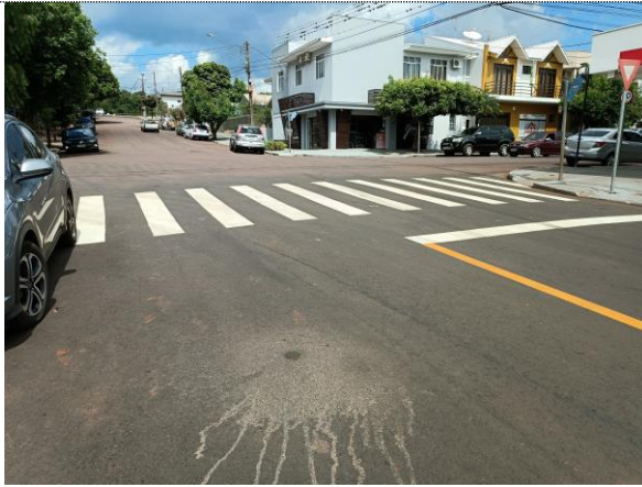
Sinalização horizontal Rua Duque de Caxias.